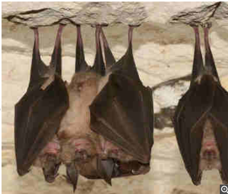
Un animal encore trop méconnu.