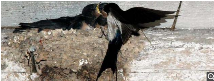
La LPO prépare aussi le retour des hirondelles et invite les Amboisiens à compter les nids.

Les hirondelles – qui sont protégées – et les martinets ont un rôle essentiel dans l'équilibre des écosystèmes en régulant les populations d'insectes, rappelle la LPO. Le prochain atelier de fabrication de nids d'hirondelles – cette fois – se déroulera samedi 5 mars (*).