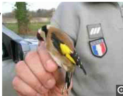
Un chardonneret élégant

Vous êtes ici : Actualité > Faits divers, justice > Trafic de chardonnerets élégants : prison avec sursis pour deux braconniers