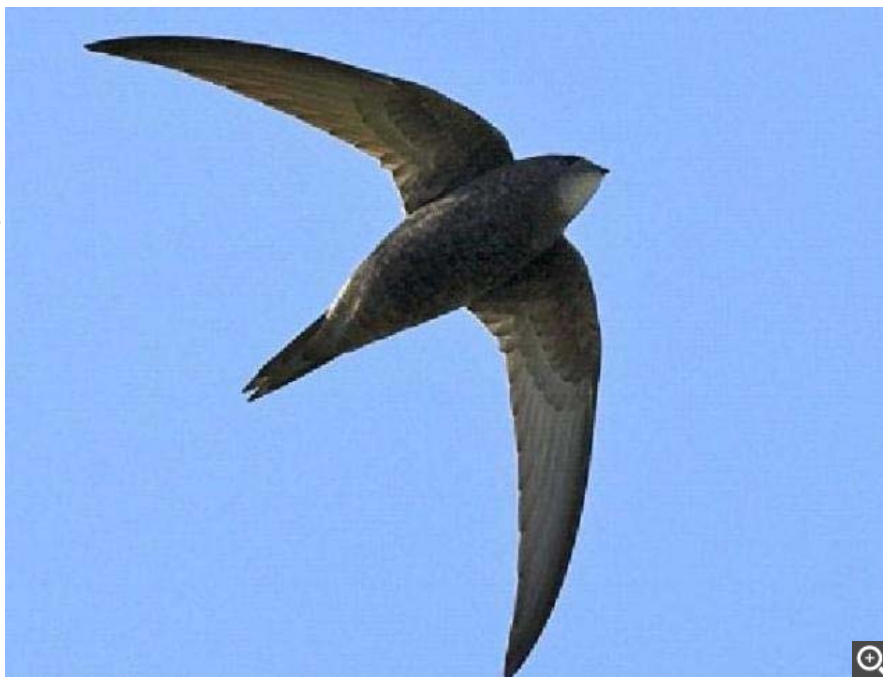
Les jeunes martinets noirs sont particulièrement vulnérables au moment de quitter leur nid pour prendre le chemin de l'Afrique.

Le reste de l'Actualité en vidéo : Présidence de la région Bretagne: Le Drian pr