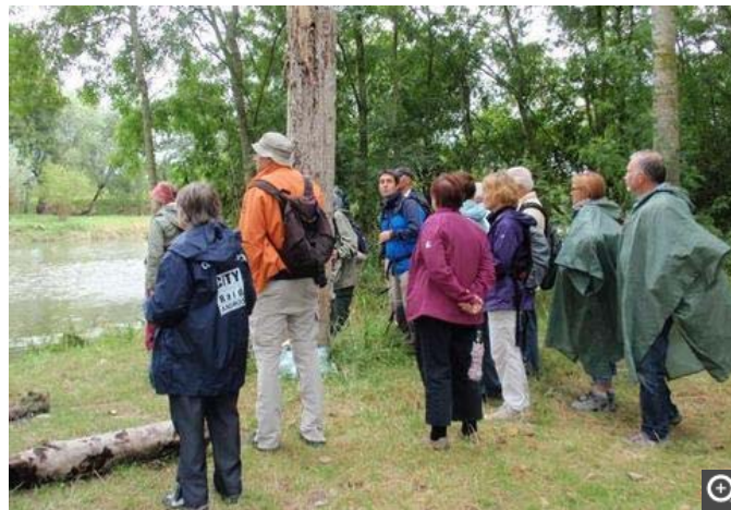
Des participants ravis et emballés !

Deux heures et demie de visite plus tard, le groupe se sépare ravi. Ces animations, soutenues par le conseil général d'Indre-et-Loire et le PNR Loire-Anjou Touraine sont toujours d'une grande qualité.