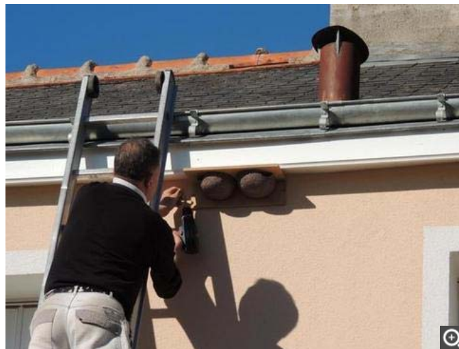
Des nids tout neufs attendent les hirondelles avec le printemps, dans les logements de Val Touraine Habitat à Beaulieu-lès-Loches.