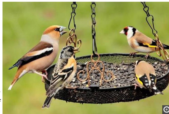
Cet hiver, les gros-bec casse-noyaux, pinsons du Nord et chardonnerets élégants se font plus rares près des mangeoires.