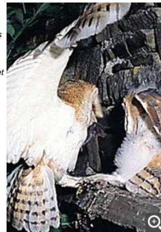
De nombreuses effraies des clochers ont été observées dans le sud du département.

Pour participer à l'opération « J'observe, je clique », il suffit de se connecter sur le site www.faune-touraine.org