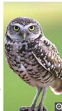
L'urbanisation menace ce petit rapace nocturne dans l'agglomération de Tours.

Aujourd'hui, la LPO Touraine lance un appel à la population pour multiplier ces implantations. Le nichoir est fourni gratuitement et son installation est réalisée par des bénévoles. En contrepartie, les particuliers doivent s'engager à entretenir le nichoir, ne pas traiter les surfaces en herbe alentour et surtout, à respecter la quiétude de l'éventuelle famille de chevêches qui y aurait élu domicile. Ils devront également suivre l'évolution de la nichée, en cas de reproduction, et à transmettre les données (le nombre de poussins notamment), sur le site Internet www.faune-touraine.org . ou par téléphone au 02.47.51.81.84.