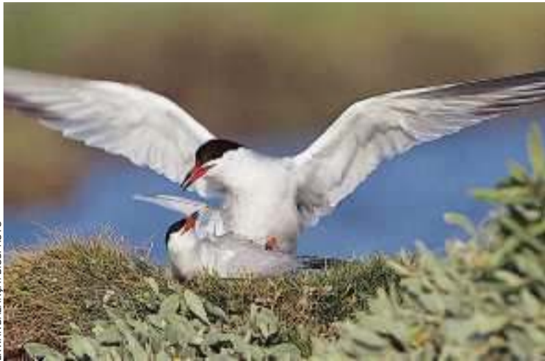
On recense près de 6 000 couples de sternes pierregarins en France.

Arrivées au début du printemps après un très long périple depuis les côtes africaines, les volatiles élisent domicile depuis des siècles sur les bords ou au milieu du grand fleuve sauvage, où ils nichent sur des grèves de sable ou de gravier. Mais leur reproduction est mise à mal par les crues tardives, de plus en plus nombreuses ces dernières années. Les vagues d'eau balayent sans ména-