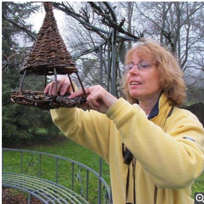
La Fevraie accueille un refuge LPO depuis sept ans.